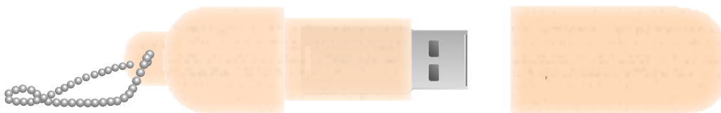
Abbildung Maßstab 1:1