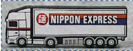
Bestehendes USB Modell