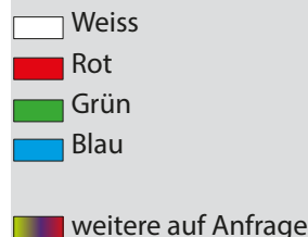
Abbildung Maßstab 1:1